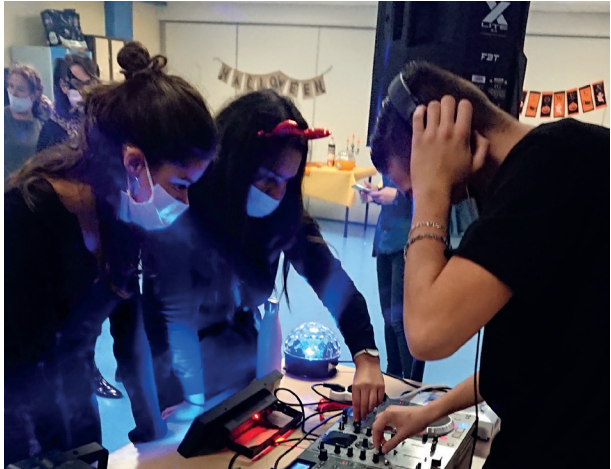
Photos prises avant les vacances d'octobre