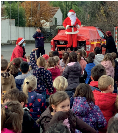
Les délégués des classes de l'école élémentaires Saint Augustin présentent les boîtes «cadeaux» (plus de 380) préparées à l'attention des plus démunis.

Le père Noël était accueilli par des chants à l'école maternelle le 18 décembre.