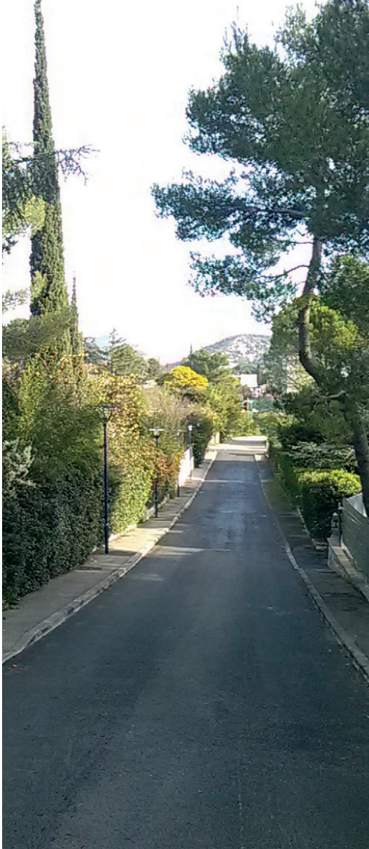
Enfouissement des réseaux quartier des Flores.