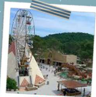
OK CORRAL SORTIE POUR LES 6/11 ANS