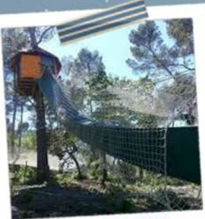
BOIS DES LUTINS SORTIE POUR LES 3/5 ANS